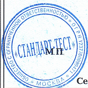
Схема сертификации: 1с.